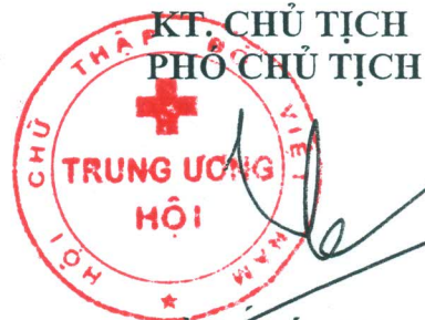
Trần Quốc Hùng